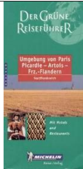
Der Grüne Reiseführer - Nordfrankreich Michelin

WERFEN SIE AUCH EINEN BLICK AUF FOLGENDER INTERNET-SEITE (DIE INTERNETSEITE NUR FÜR DIE PRESSE!)